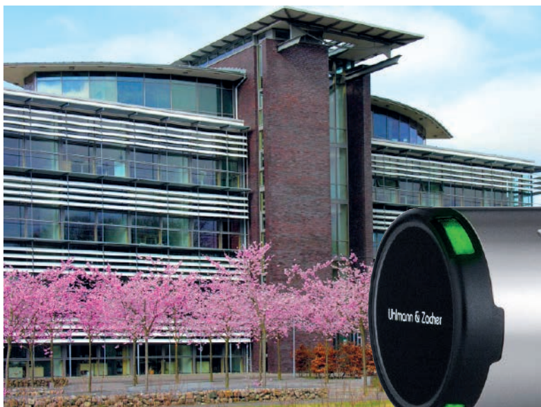
◀ Das Gründerzentrum Log-in in Neumünster